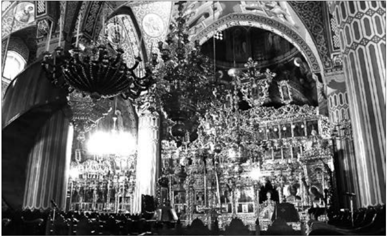
Иконостас собора Киккского монастыря

Но вот что рассказывают. На меже XVII–XVIII веков Александрийский патриарх Герасим якобы приподнял покров и увидел лик — и был наказан слепотой. Со слезами он просил Бога и Его Пречистую Матерь простить его. Правда, официальной истории такой факт неизвестен. Да и благовейный святитель отличался величайшей кротостью.