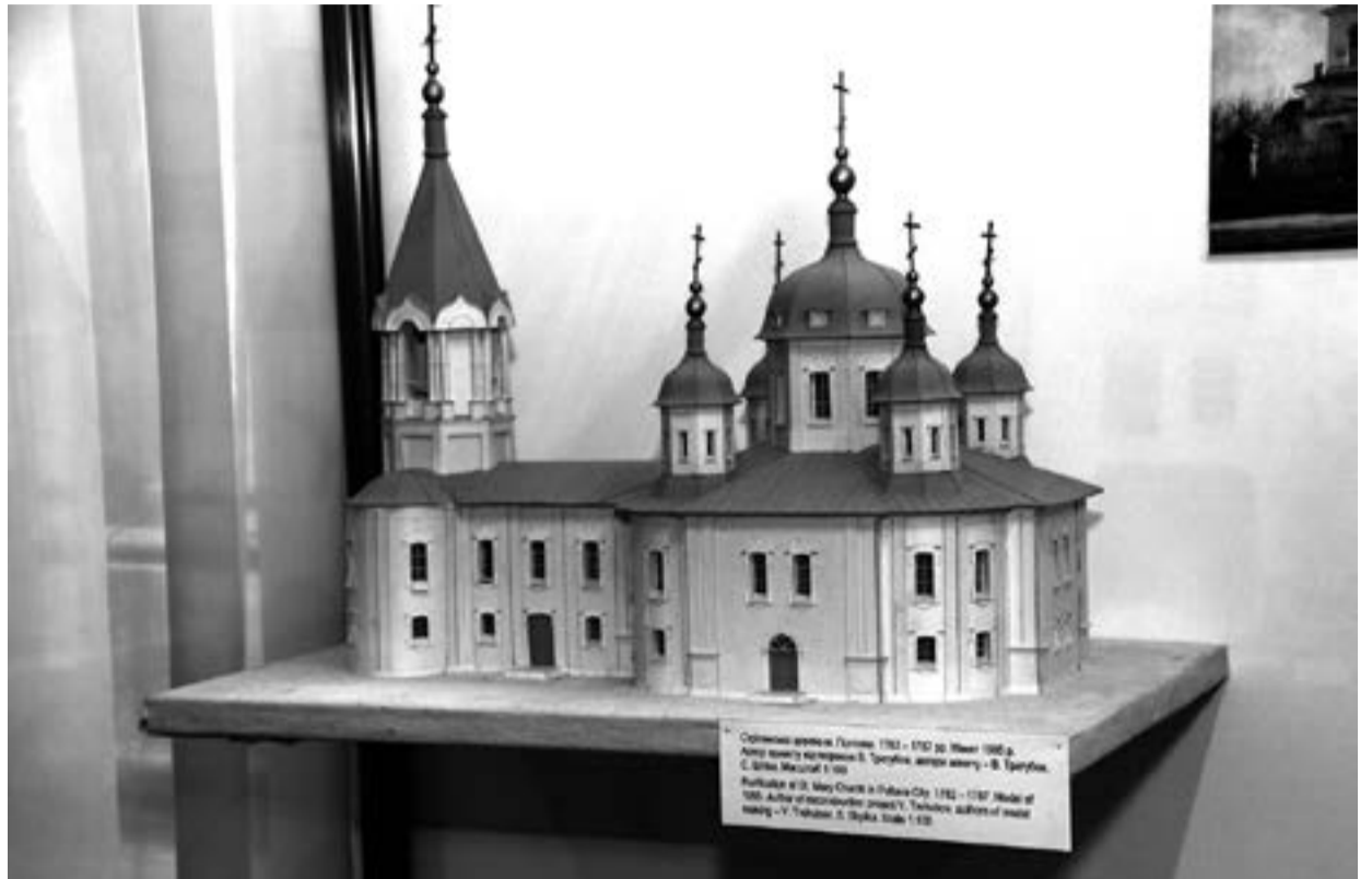
Макет Стрітенської церкви, виготовлений архітектурною студією «Храм»

цію, використавши в плануванні форму рівнокільцевого грецького хреста із заокругленими сторонами, над якими розмістив світлові барабани, зорієнтувавши їх за сторонами світу. Як показує ситуаційний план, споруда при цьому була зведена під кутом до головної вулиці міста.