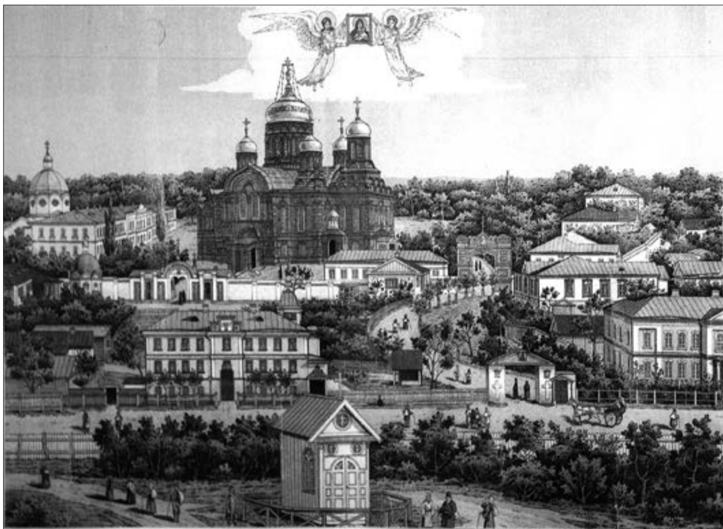
Вид на Козельщанский монастырь в начале XX века (гравюра) и в начале XXI века (фотография)