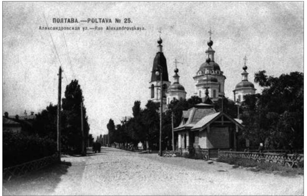
Стрітенська церква на Олександрівській вулиці. Фото початку ХХ століття

морovou язvu. Она началась из Полтавщины и протянулась в Польшу и Галицию, от чего весьма много померло людей везде, а паче в Киеве и в лучших городах, в которые обыкновенно во время руин стекается народ со всех разоренных селений и приносит с собою бедность, отчаяние, болезни и саму смерть. Сему губительству изрядному сопутствовало другое его несчастье, равнявшееся почти первому: зловредная саранча, прилетевшая, как грозные тучи, из обыкновенного отечества своего... и закубанских степей, напала на Малороссию и съела до корня засева хлебные и все произрастающее». Пізніше, коли загроза епідемії спала, полтавські передмістя почали інтенсивно забудуватися, і постала потреба в нових парафіяльних церквах. Стрітенську церкву знову перебудували. Старе кладовище закрили, а нове, міське ж, було організовано зовсім в іншому місці: воно знаходилося на території сучасного центрального ринку. Згодом там збудували й першу ще дерев'яну Всіхсвятську церкву.