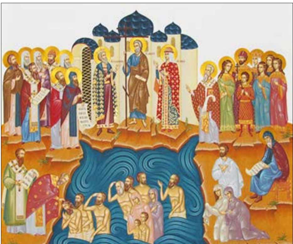
«Хрещення Русі». Розпис у храмі преподобного Нестора Літописця Полтавської Місіонерської Духовної семінарії