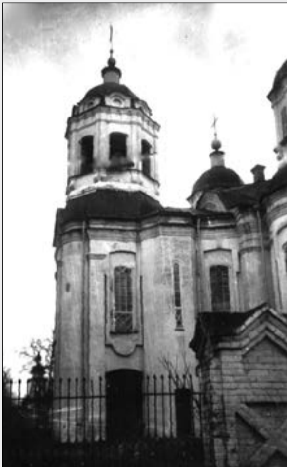
Стрітенська церква у Полтаві. 1930 рік