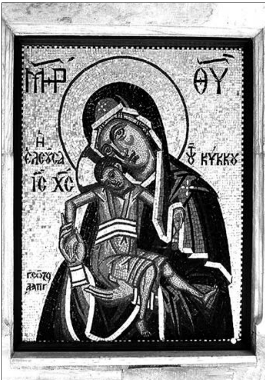
Этот мозаичный список Киккской иконы Божией Матери встречает паломников у входа в монастырь