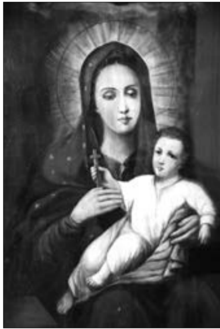
Козельщанская икона Пресвятой Богородицы: список времен основания обители из запасников Полтавского краеведческого музея и чудотворный образ в теплом храме монастыря

В селе Козельщина Кобеляцкого уезда, на месте прославления дивными чудесами образа Богоматери, было решено устроить женскую общину как учреждение, которое наиболее соответствовало бы высокому религиозному значению этого места. Было возбуждено об этом ходатайство пред Святейшим Синодом, и 1 марта 1885 года получен указ с разрешением открыть женскую общину. Нужно