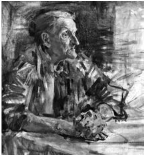
Художник Валерій Крылатов