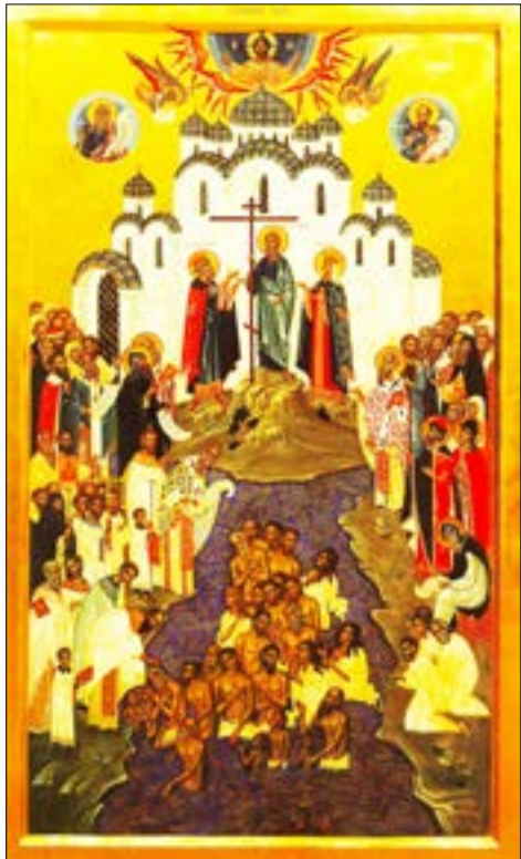
«Хрещення Русі» архимандрита Зінона (Теодора)

у правій руці, який він, за переказами, поставив на Київських горах на знак початку християнської проповіді на слов'янських землях. Оскільки канонічна ікона є позчасовою, на ній зображуються святі та події, що відбувалися в різний час. Так, поруч з апостолом Андрієм зображені рівноапостольні княгиня Ольга і князь Володимир. На берегах Дніпра бачимо групи людей, що готуються до хрещення і сприймають проповідь прибулих з Візантії священнослужителів. Священство, що прийшло хресним ходом, наставляє у християнській вірі і хрестить киян. Трохи вище над цим дійством розташовані святі, які протягом століть потрудилися в просвіті народу. Рівноапостольні Кирил і Мефодій тримають сувій — слов'янську абетку, преподобний Нестор Літописець записує події, що відбуваються; мученики Борис і Гліб моляться. Усі вони розташовані на виступах гір — символи духовного сходження людини. У воді стоять люди, над якими звершується Таїнство Хрещення. Хвилі виконані не просто фарбою, але й асістом (золотий декор у вигляді променів, завитків, орнаментів тощо), мовби підкреслюють святість вод Дніпра, створюючи алюзію Йордану, де Христос прийняв Хрещення від Іоанна. На задньому плані зображений величний собор, обабіч нього в медальйонах зі сувоями пророк Ісаїя і апостол Павел. Очолює композицію Христос у славі, Який благословляє Таїнство Хрещення, в оточенні сонму ангелів.