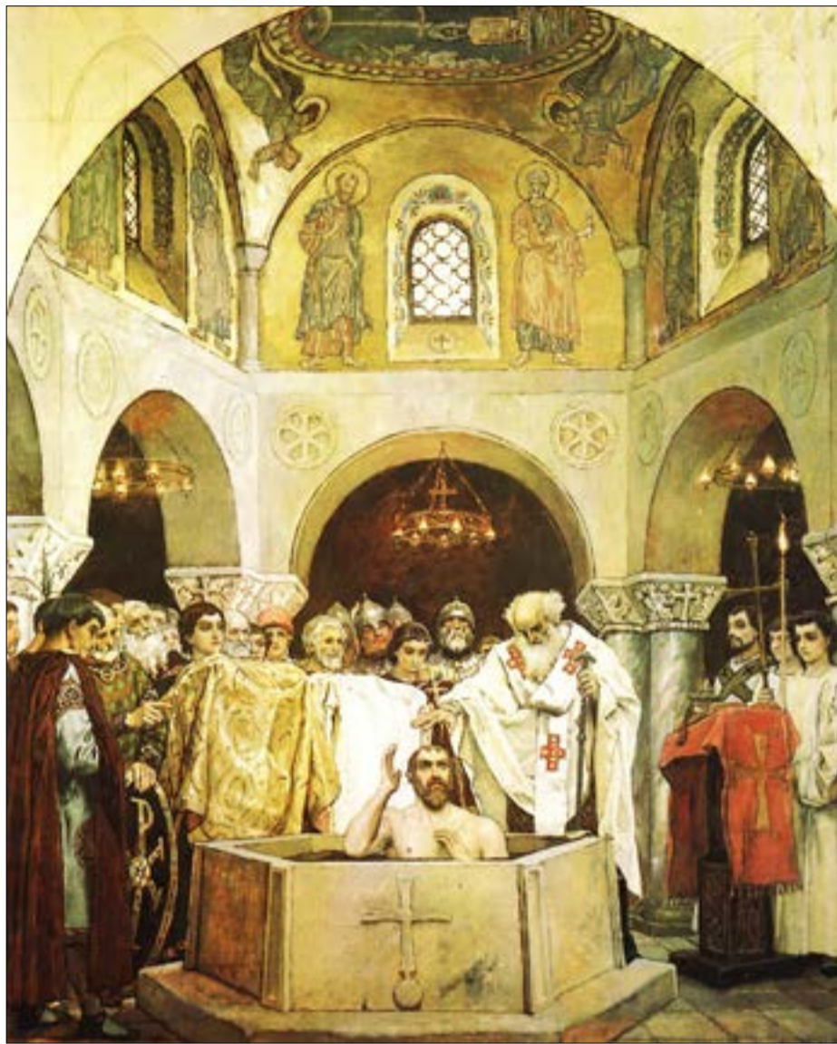
«Хрещення князя Володимира». Розпис у Володимирському соборі Києва

Повертаючись безпосередньо до питання формування іконографії «Хрещення Русі», потрібно