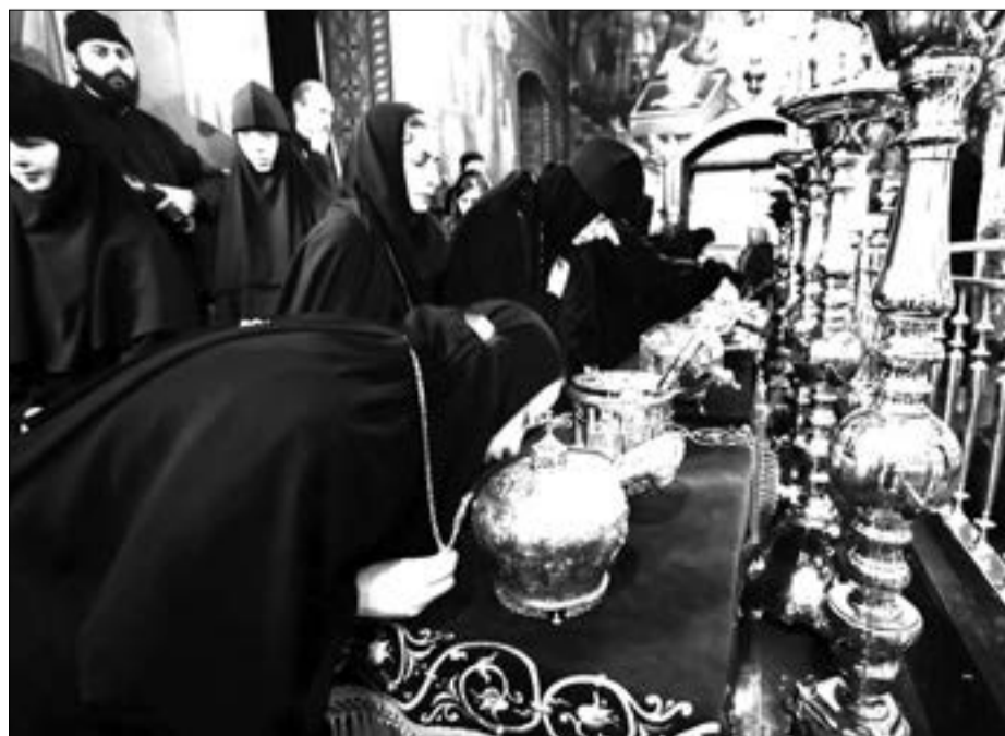
Паломники в Киккском монастыре прикладываются к святыням