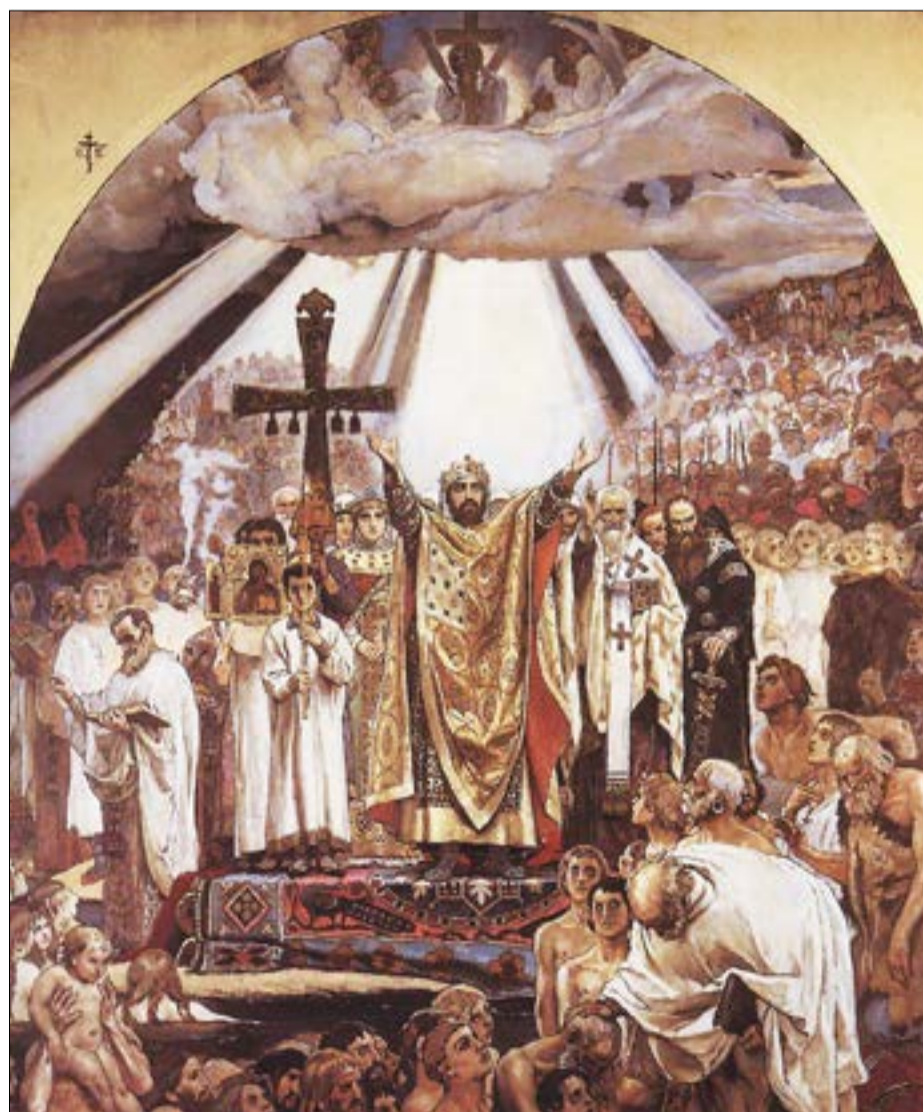
«Хрещення Русі». Розпис у Володимирському соборі Києва

сказати, що композиції хрещення князя існували, але вони були лише малою частиною ансамблю розписів тих чи інших храмів. У мистецтві Російської імперії XIX–XX століть образ святого рівноапостольного князя Володимира займає помітне місце. Він став майже обов'язковою частиною декорації найбільших соборів. Серед творів, пов'язаних з 900-річним ювілеєм Хре-