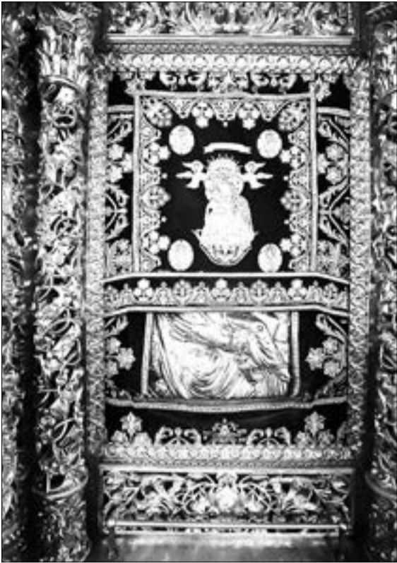
Лик Богородицы на Киккской иконе в иконостасе собора обители всегда сокрыт платом