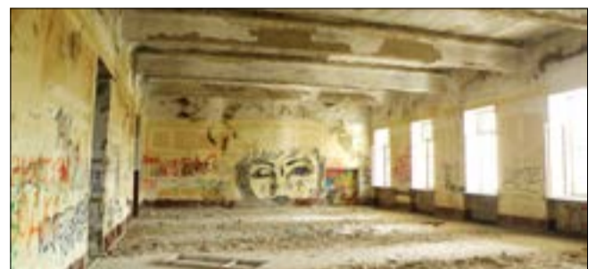
Сучасний стан колишнього кадетського корпусу у Полтаві