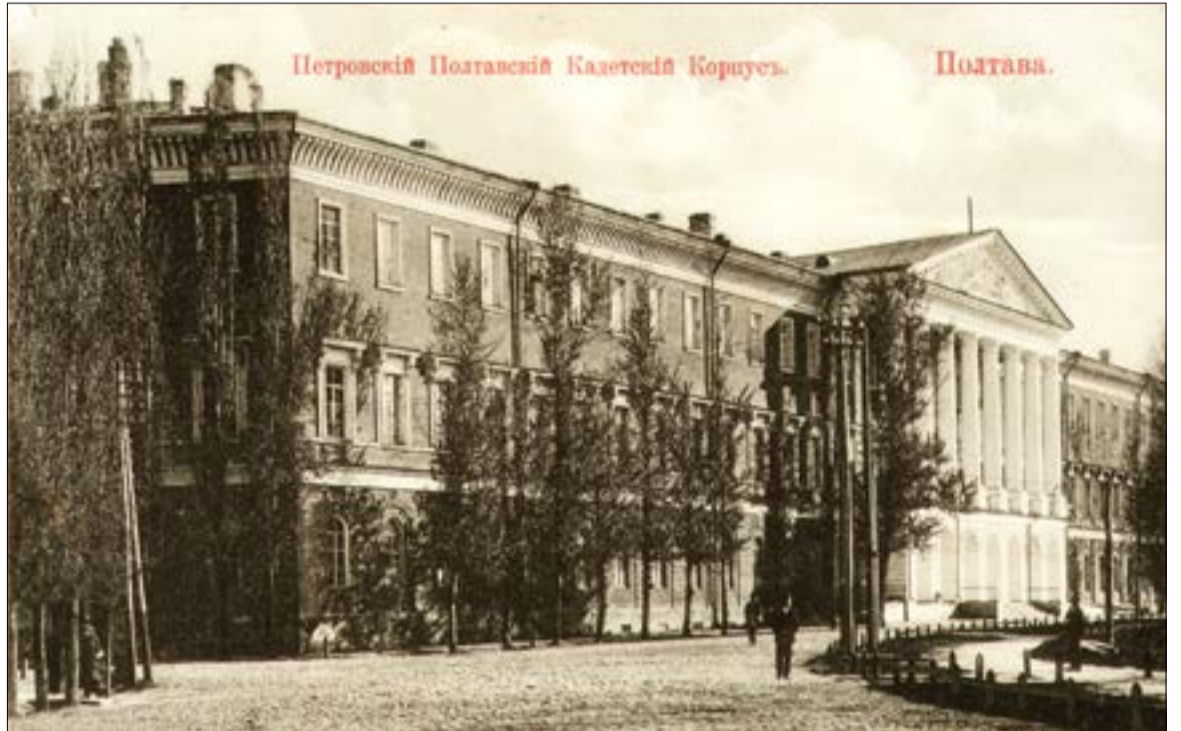
Початок ХХ століття