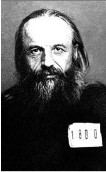
Тюремная фотография из «дела»

(в настоящее время в нём находится управление СБУ в Полтавской области, ул. Соборности, 39). Против него было возбуждено «политическое» дело.