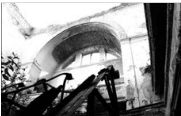
Сучасний стан колишнього кадетського корпусу у Полтаві

Від редакції. Поки верстався березневий номер «Відомостей Полтавської єпархії», за участю організації «Промпроєкт» розпочалися роботи з виготовлення науково-проектної документації щодо консервації та протиаварійних робіт у кадетському корпусі. Є сподівання, що протягом 2020 року будівля отримає новий дах.