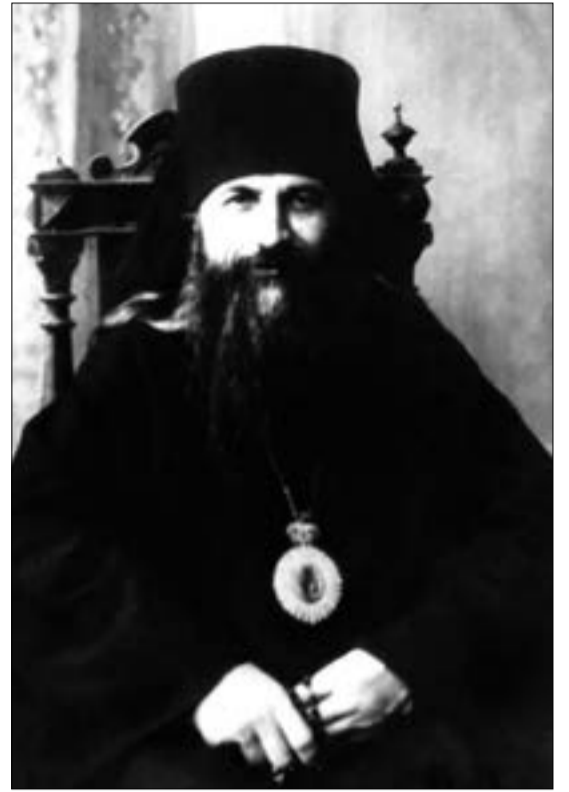
Епископ Василий (Зеленцов): на иконе и фотографии

ее в зависимость и под наблюдение несформированного еще государственного строя.