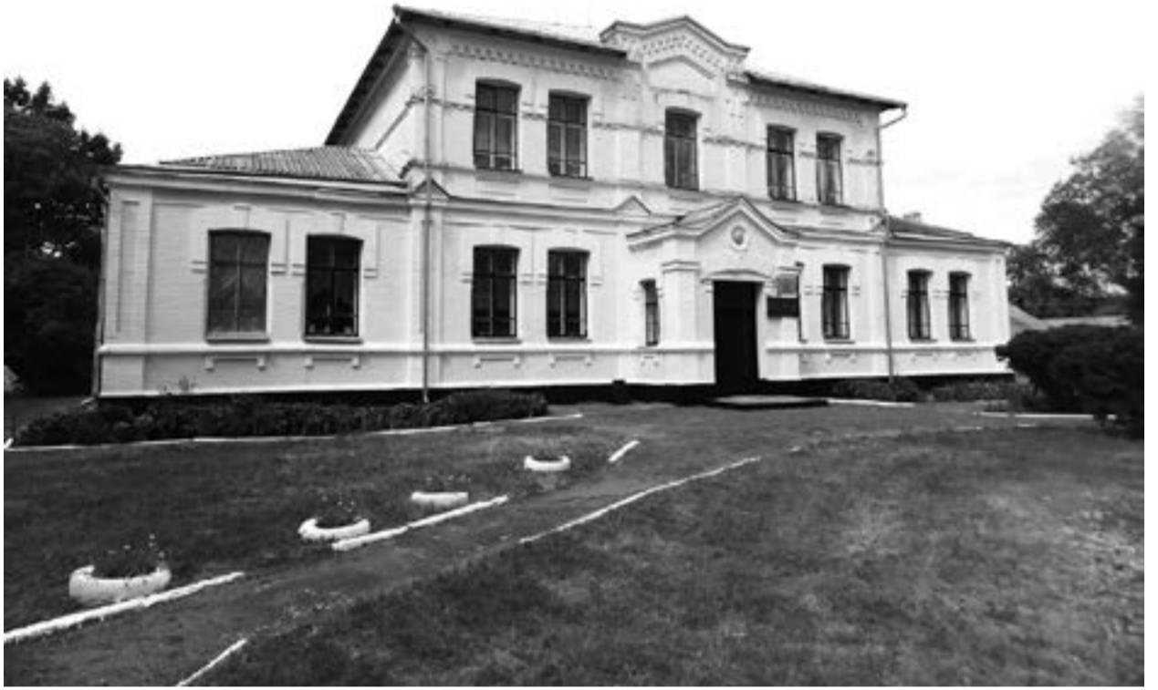
У цьому шкільному приміщенні села Ждани у роки Великої Вітчизняної війни працював госпіталь