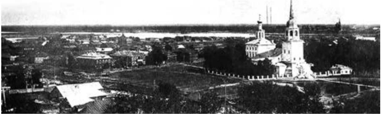
Архангельский Морской Преображенский собор

Вспомоществование почти вдвое превышало сумму жалования, получаемого тогда полковыми священниками.