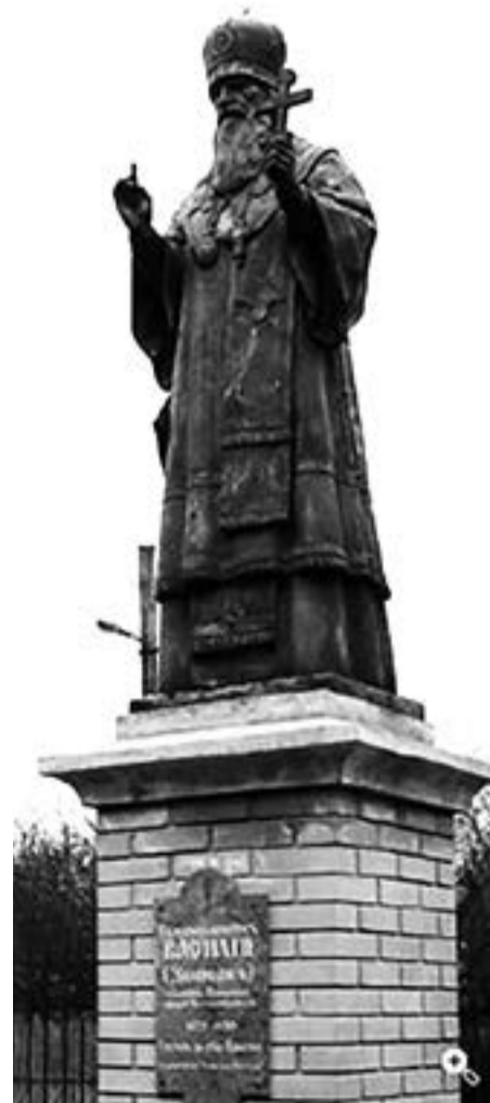
Памятник священику Василию Полтавскому в ограде Макариевского кафедрального собора