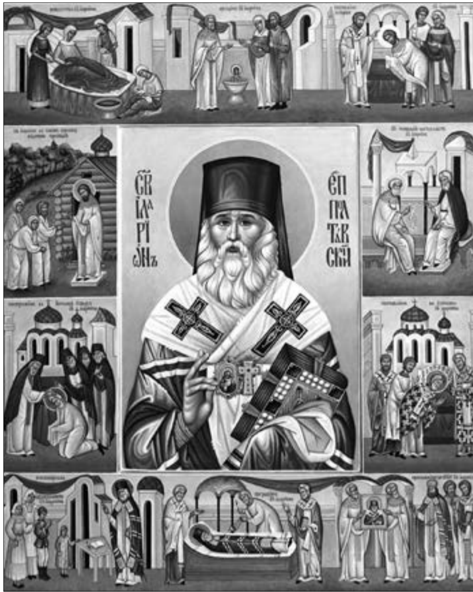
Житийная икона святителя Илариона

Оправившись от очередного потрясения, архимандрит Иларион вновь отправился на богомолье в Киев. Это паломничество коренным образом изменило его дальнейшую жизнь. Киевский митрополит Филофей (Успенский), разглядев в нем талантливого администратора, сделал его наместником Киево-Печерской Лавры. В этой должности отец Иларион пробыл шесть лет. За это время он отремонтировал Лаврскую колокольню и Великую церковь, возобновил после пожара типографию, провел водопровод. Но более всего он заботился о духовном росте монашествующей братии, для которой стал и любящим отцом, и настоящим примером. Под сенью Киево-Печерской обители уже немолодой