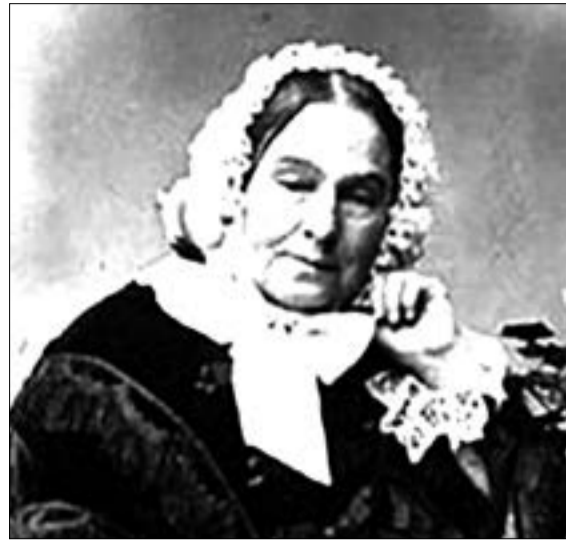
Родители Николая Гоголя — Василий Афанасьевич и Мария Ивановна