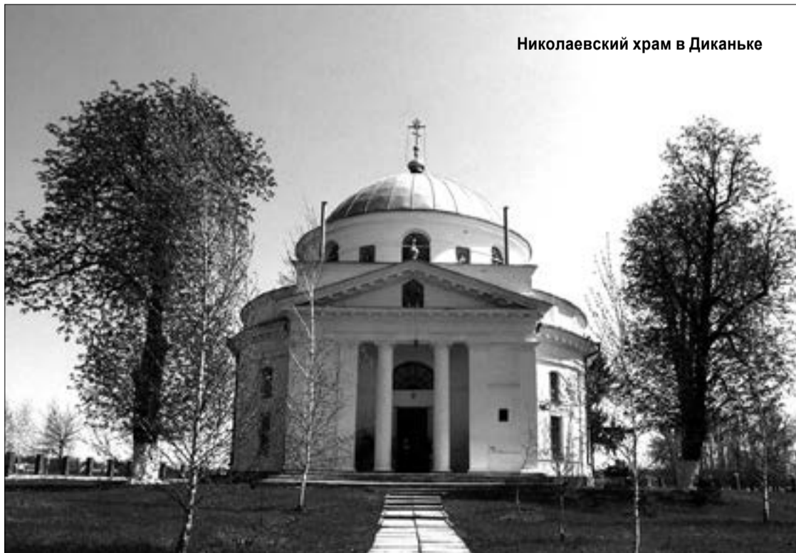
Николаевский храм в Диканьке