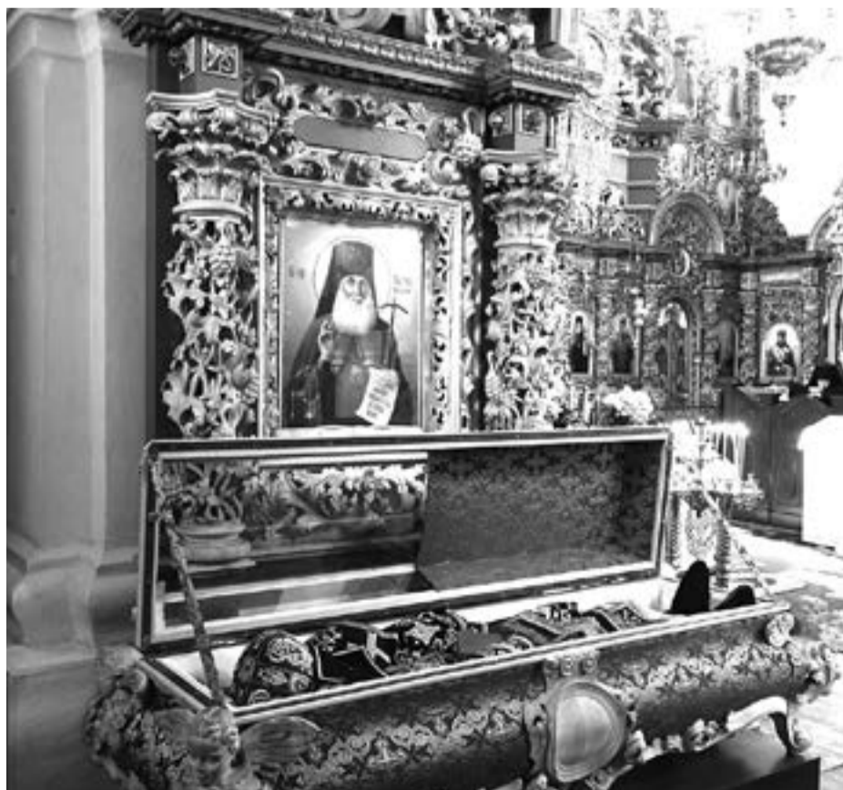
Мощи святителя Илариона в Полтавском Крестовоздвиженском монастыре