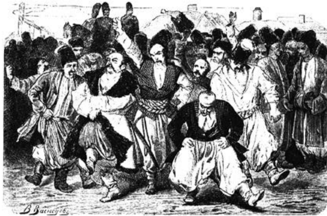
Иллюстрация В. Васнецова к повести Н. Гоголя «Тарас Бульба», 1874 год