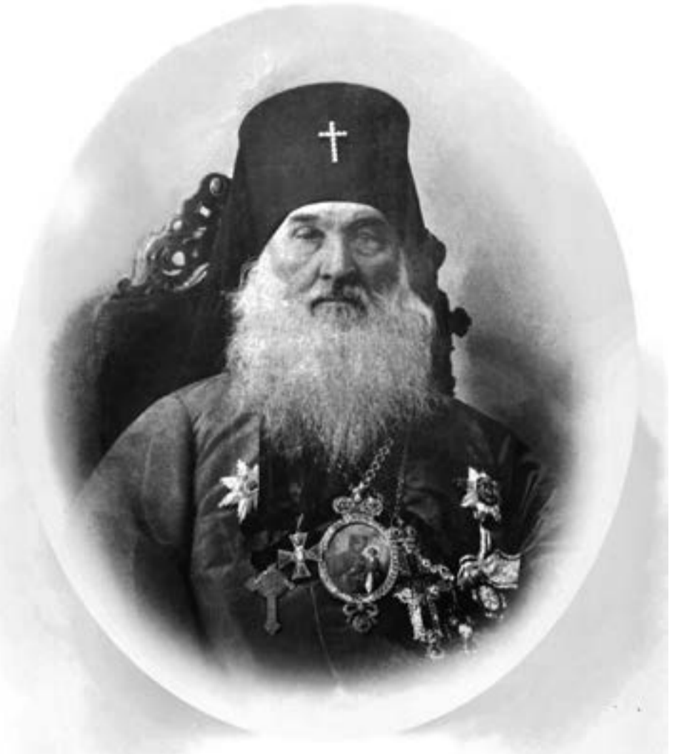
Святитель Иларион Полтавский

Родился Владыка и провел первую половину жизни далеко от этих мест — в Смоленской губернии, в семье священника. Имя его в ту пору было Иван Юшенов. Окончив в 1843 году Смоленскую духовную семинарию, девятнадцатилетний юноша хотел продолжить образование в духовной