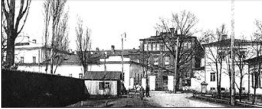
Район Колония в дореволюционной Полтаве

Дети деревни, возросшие на лоне природы, мы в стенах училища всецело находились в ее власти. Во время экзаменов, в чудные майские дни, каждый искал себе для занятий укромный уголок на свежем воздухе: где угодно, лишь бы не в классе! Одни лезли в костры дров, другие взбирались на деревья. В саду под каждым кустиком в шалашах из травы