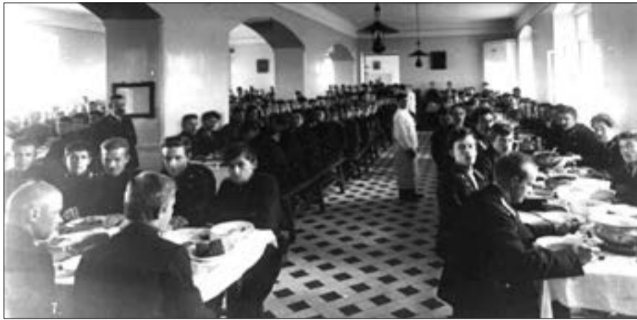
В столовой одной из семинарий Российской империи

слышался смех, хохот или зубрячка. Ребята познергичнее забирались, не взирая на бдительный надзор, в чудный тогда монастырский лес и на берега Ворсклы. Злополучный архиерейский сад и в наше время много доставлял хлопот начальству: почти ежедневно кто-либо извлекался оттуда и препровождался прямо в карцер. Так же неотразимо влекла нас и полная прелести и грусти задумчивая умирающая осенняя природа: «цветы последние милей роскошных первенцев полей». И правда: так и тянет, бывало, уйти за город, в поле, в лес, в таинственную сень обнажающегося сада, не своего, казенного, а чужого. «Хороши наши ребята, только славушка дурна», — горланит, бывало, шагая в ногу, по окраине монастырского леса и не догадываемся, что эта солдатская песня очень и очень подходит к нам. Слава шла про нас неважная. Казалось, ничего дурного за нами и не водилось, а «бурсак» — этот синоним грубости и невежества — частенько-таки посылали нам вдогонку. Правда, поведение наше не всегда было корректно и безупречно, но мы знали гимназистов и кадетов, которые куда почище нас, и всё же их огульно не порицали, не звали бурсаками, а иногда даже в пример ставили нам. И если мы иногда вольничали и задирали прохожих, то только у себя, на Колонии, где чувствовали себя как дома. Колония в то время свободно могла украсить собой любое торговое местечко. Кроме училищного и семинарского корпусов, на этой грязной, пыльной малолюдной улице красовались довольно ветхие жалкие домишки, где ютилась