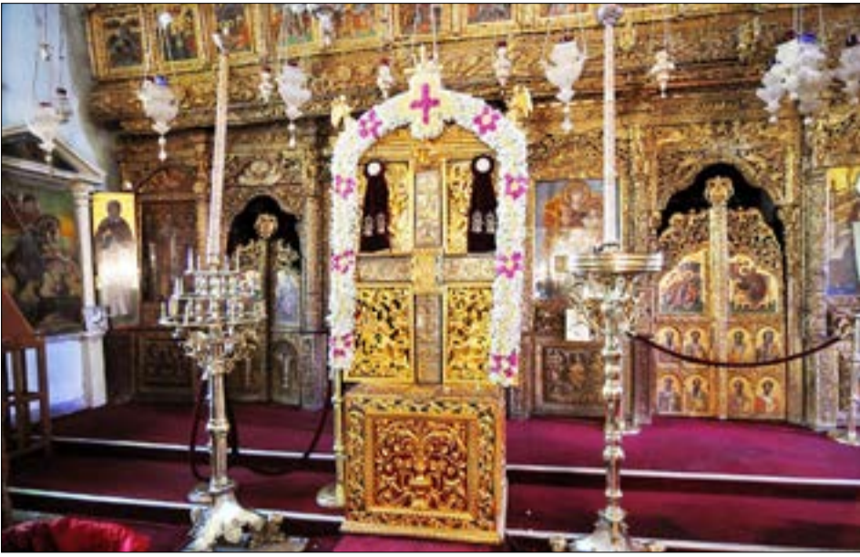
Крест с фрагментом Животворящего Креста в храме Святого Креста

реликвия — серебряный крест, которому уже более семисот лет. Именно поэтому отмечаемый в сентябре праздник Воздвижения Честного и Животворящего Креста проходит здесь особенно торжественно и при большом стечении верующих.