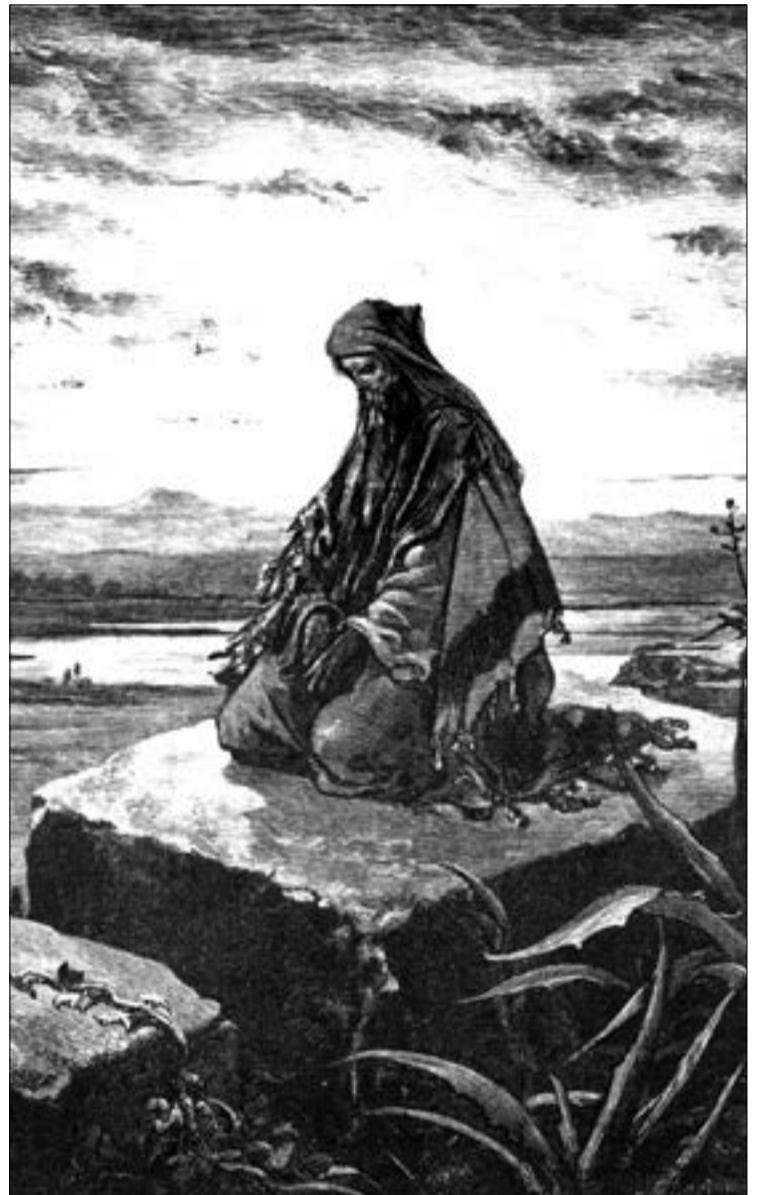
Гюстав Доре «Пророк Исайя»

от других царей, будет Посланником Господа или даже Самим Господом. В этом мессианство Исайи — он пророчесствует о Мессии, о Благой Вести. В главе 40-й Книги пророка Исайи он говорит: «Взойди на высокую гору, благовествующий Сион! Возвесь с силою голос твой, благовествующий Иерусалим! Возвись, не бойся; скажи городам Иудиным: вот Бог ваш!» (Ис. 40:9). Конечно, для апостолов — авторов Евангелия — очевидно, что он говорит об Иисусе. И нет причин не согласиться с ними. В некотором смысле Исайя — первый евангелист, который говорит о некоем Человеке, приносящем людям Новую Жизнь.