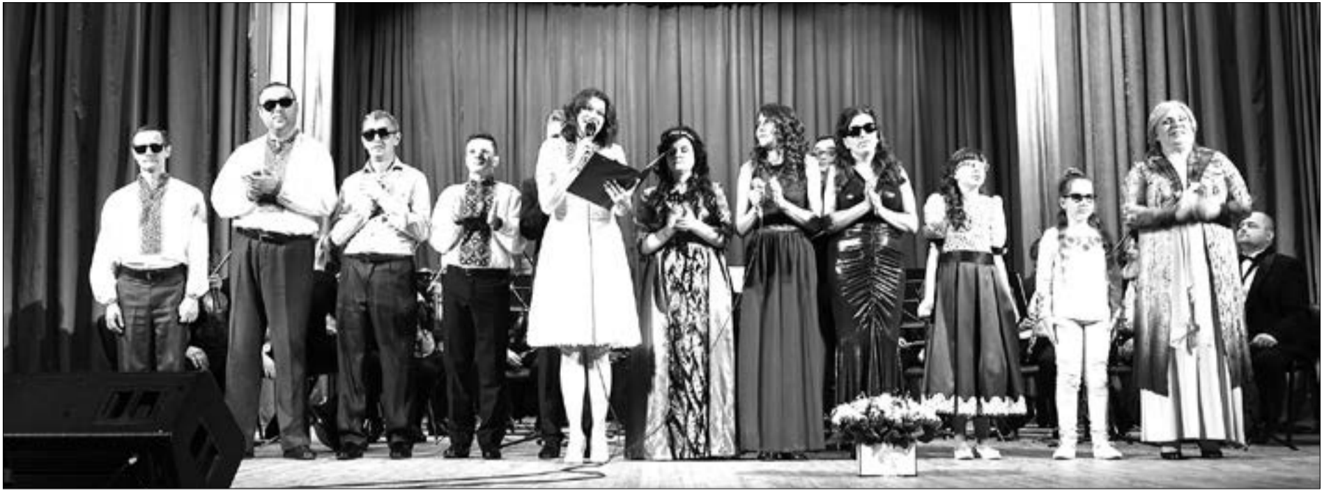
На полтавській сцені — незрячі артисти