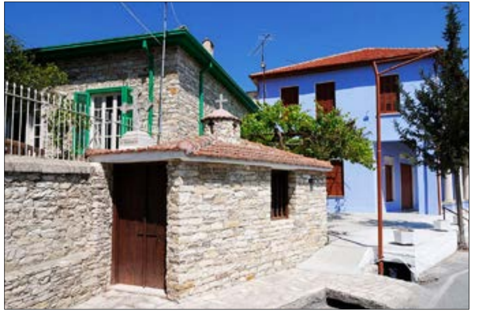
Церковь святой Параскевы