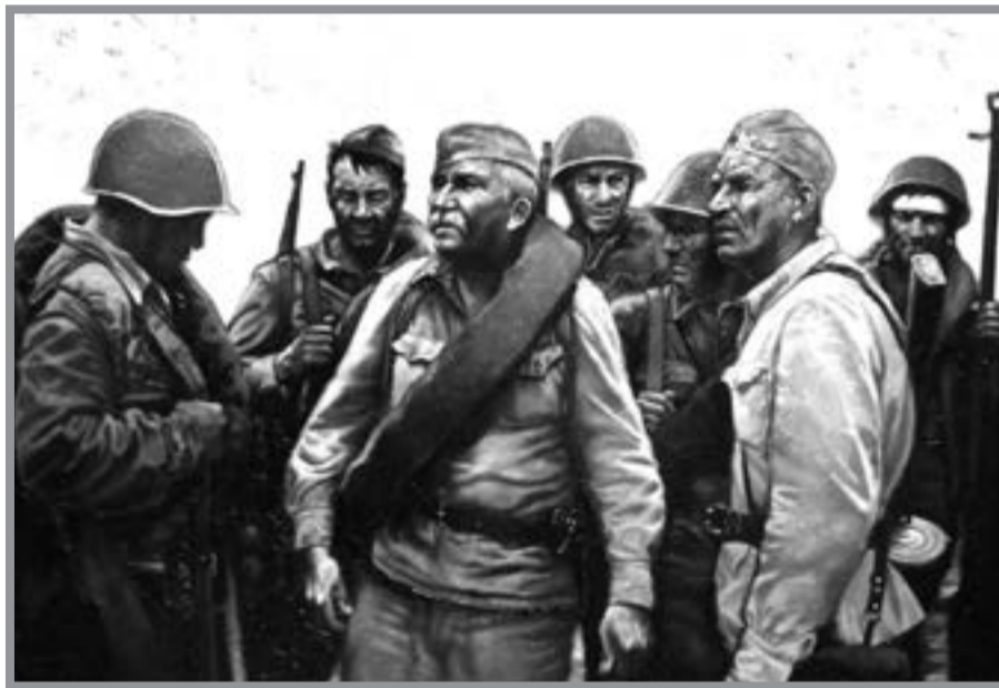
Микола Підгорний «Солдати Перемоги»

а потім відбудовували понівечену Батьківщину. Наш зв'язок із цими людьми кровний, душевний, що б там не говорили нинішні пропагандисти від історії. Нам є за що поважати дідів, прадідів, є перед ким схилити голови з болем, скорботою, але й підносити їх з радістю, сльозами щастя. Наступного 2020 року люди з різних країн і континентів святкуватимуть 75-річчя Перемоги у Великій Вітчизняній та Другій світовій війні. Даті, що минула, і даті, що наближається, присвячуємо ми низку публікацій. Нехай Господь не позбавляє нас пам'яті серця, нехай упокоїть душі братів і сестер, загиблих у тій війні.