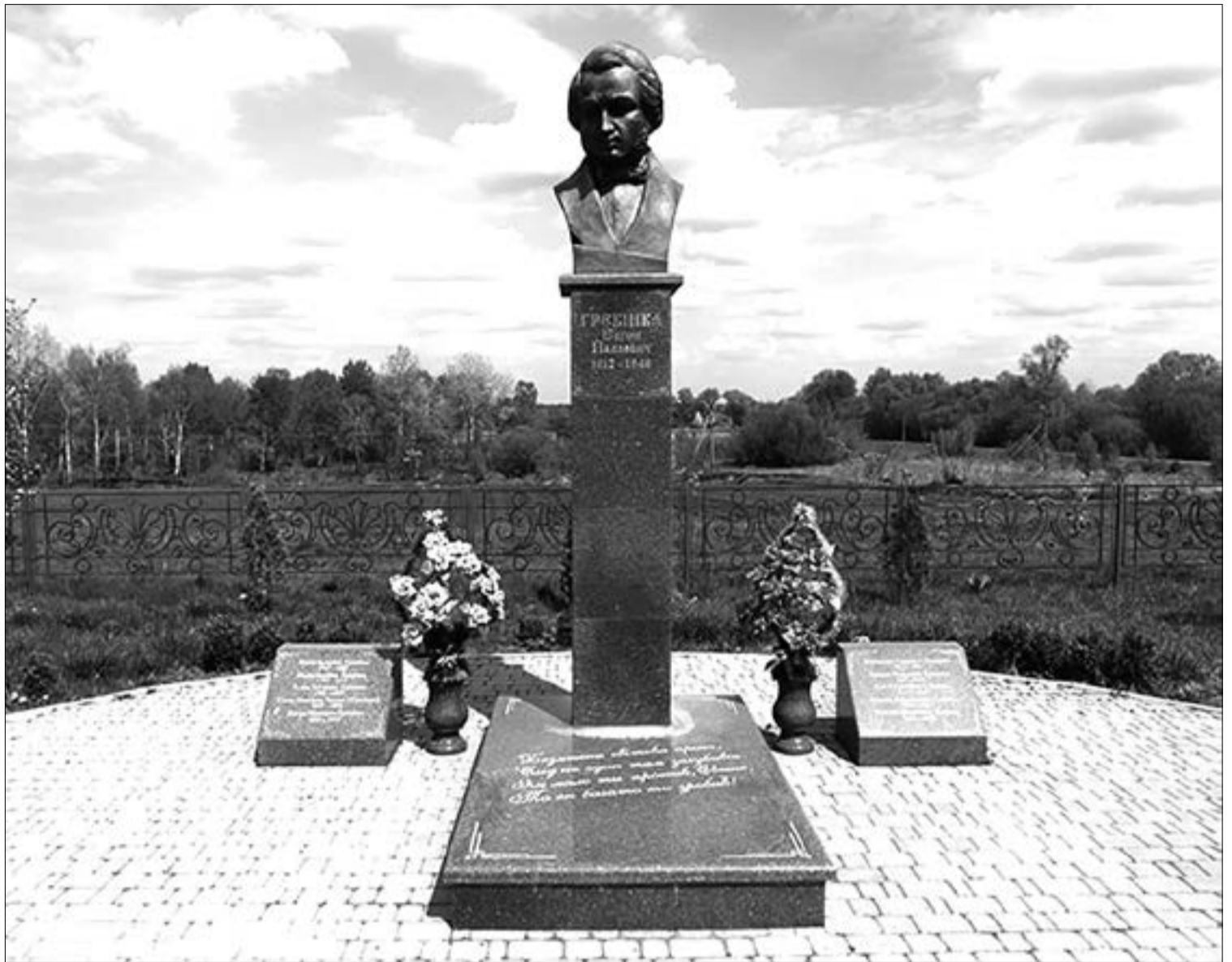
Могила Е. П. Гребёнки в селе Марьяновка Гребёнковского района на Полтавщине

В столь печальном виде — «заброшенной, опустевшей, лишённой простого ветхого креста, заросшей сорняками», как пишет один из местных краеведов, нашли могилу Евгения Павловича работники Прилукского музея, которые в июле 1928 года первыми после печально известных событий 1917-го побывали в имении и на кладбище Гребёнок (эта местность соответственно административному делению того времени входила в состав Прилукского округа). Они сфотографировали домик садовника («катражку», где, называя их Петербурга, жил Евгений Павлович и писал свои произведения). Из школы забрали портрет Е. П. Гребёнки, благодаря чему он и дошёл до наших дней: полотно сохранялось сначала в Прилукском музее, а затем в Черниговском областном художественном музее имени Григория Галагана (ранее упоминавшийся нами «Портрет Евгения Гребёнки» А. Мокрицкого). Эти музейщики будто бы поднимали в то время и вопрос