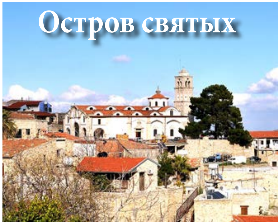
Вид на храм Святого Креста

Вступая в брак, молодые люди непременно венчаются в церкви. Кстати, венчание на Кипре имеет юридическую силу и не требует дополнительной регистрации брака в государственных органах. Когда человек умирает, его обязательно отпевают в церкви и хоронят по-православному, после чего справляют поминки. И если в какой-либо из горных деревень вы спросите