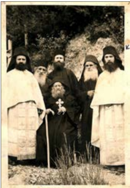
Старец Иосиф Исихаст с сотаинниками и учениками на Афоне. Крайний справа Ефрем Филофейский

голода и холода, переносил поношение от старца и хранил полное молчание. Сам старец Иосиф почти всю ночь творил Иисусову молитву, этому учил и своих послушников. Один из монахов в Америке много позже вспоминал: «Я познакомился с отцом Ефремом на Афоне. Он тогда спал на полу, прямо под дверью своего старца. И ночью, если кто-то стучал, он выходил и говорил: «Подождите, старец молится или отдыхает». Сейчас такого уже не встретишь!»