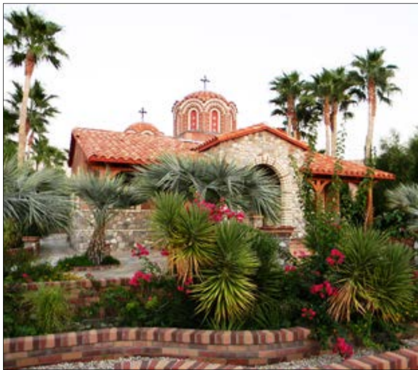
Монастырь святого Антония Великого в Аризоне, основанный старцем Ефремом Филофейским