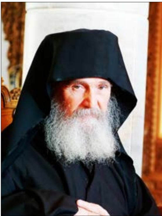
Архимандрит Ефрем Филофейский

С этого времени для юного Иоанниса началась настоящая школа молитвы и послушания. Искусный учитель, каким был старец Иосиф, с любовью и терпением возвращал его душу, словно прекрасную лилию, удобряя добродетелями и искореняя из нее сорняки — греховные страсти. Однако обучение в этом «университете пустыни» было подобно обтесыванию топором. Ефрем (такое имя он получил в монашестве) каждый день трудился до изнеможения, а каждую ночь проводил под открытым небом в молитве, страдал от