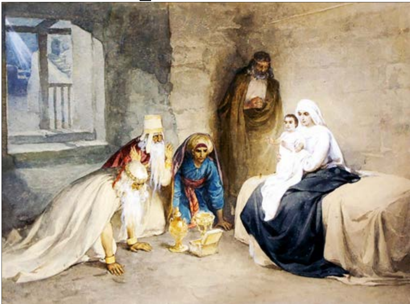
К. В. Лебедев «Поклоніння волхвів», кінець XIX — початок XX століття

Н е іскрилим снігом і морозцем, а сірою сльотою і туманами повив стежки і дороги грудень-обманщик. Але Різдво Христове прийде неминуче, хай там що! Тепер, коли піст налаштує на покаяння, славу Новонародженому Богонемовляти співаємо ніби упівголоса, ніби як о вечірній чи досвітній порі затаєно доносять до нас своє світло далекі зорі. Але розсіється імла — і Віфлеємська зірка осяє землю. Лише трохи підведи очі від набридлої буденності — і побачиш: ось вона, поруч, веде за собою, як і давно, до Ісусової колиски. Там радісно і тепло. Навіть якщо це печера. Бо радість знайдення Бога розтопить безнадію, прожене безпросвітність. І тоді вже лунко розилється по усіх куточках землі урочистий спів: «Рождество твоє Христе Божє нашє, возсіяє мірови свєтлє і зблє...»